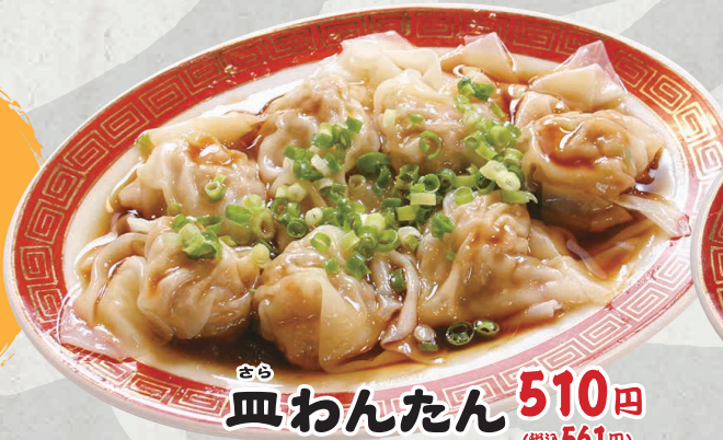
さら 皿わんたん 510円 (税込561円)