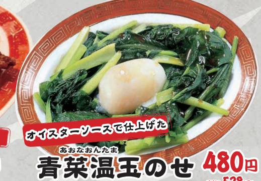
オイスターソースで仕上げた あおなおんたま 青菜温玉のせ 480円 (税込528円)