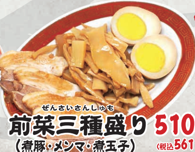
ぜんさいさんしゆも 前菜三種盛り 510円 (煮豚・メンマ・煮玉子) (税込561円)