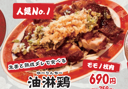
生姜と熟成ダレで食べる モモ1枚肉 ゆーりんちー 油淋鶏 690円 (税込759円)