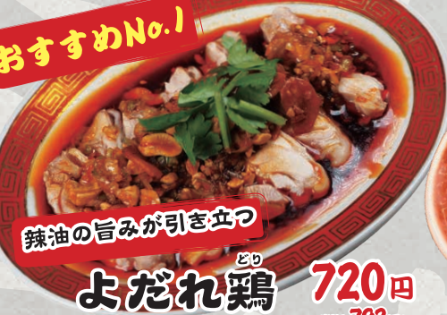
鶏 よだれ鶏 720円 (税込792円)