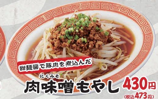
甜麺醬で豚肉を煮込んだ にくみそ 肉味噌もやし 430円 (税込473円)