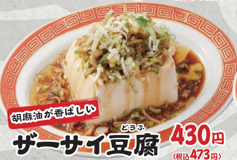
胡麻油が香ばしい 豆腐 ザーサイ豆腐 430円 (税込473円)