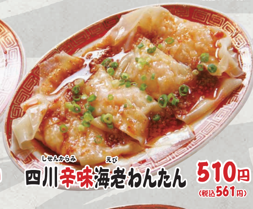
しせんからみ えび 四川辛味海老わんたん 510円 (税込561円)