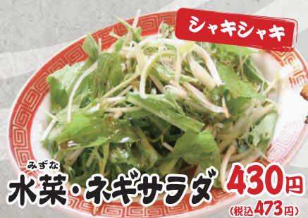
みずな 水菜・ネギサラダ 430円 (税込473円)