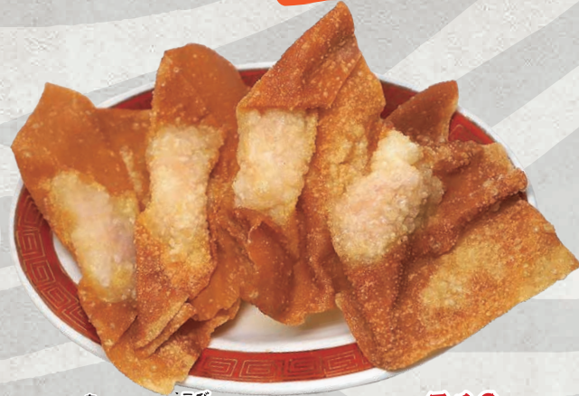
あ えび 揚げ海老わんたん 510円 (税込561円)