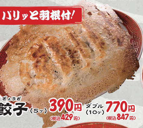
ぎょうざ 餃子 (5ヶ) 390円 (税込429円) ダブル (10ヶ) 770円 (税込847円)