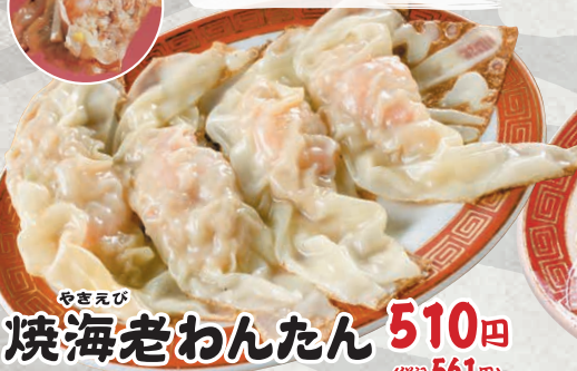
やきえび 焼海老わんたん 510円 (税込561円)