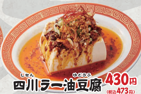
しせん 四川ラー油豆腐 430円 (税込473円)