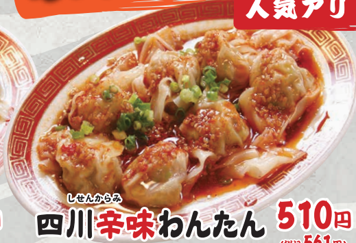
しせんからみ 四川辛味わんたん 510円 (税込561円)