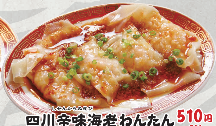
しせんからみえび 四川辛味海老わんたん 510円 (税込561円)