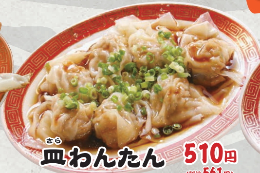
さら 皿わんたん 510円 (税込561円)