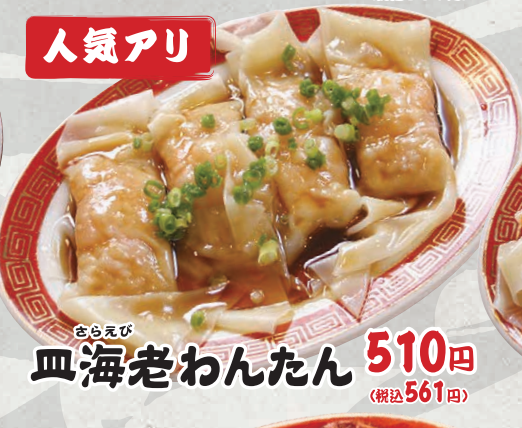
さらえび 皿海老わんたん 510円 (税込561円)