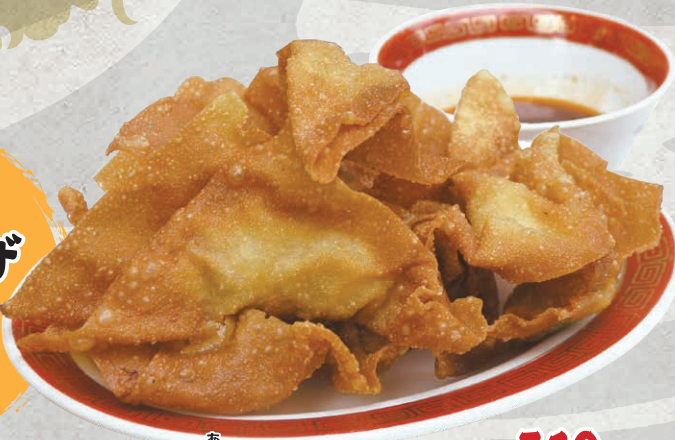
あ 揚げわんたん 510円 (税込561円)